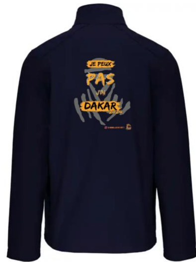
Visuel Sérigraphié Uniquement au Dos

Dessin et sérigraphie réalisés en France ■ ■